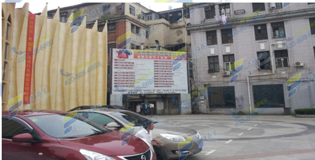
金皇冠周边居民楼

KTV 业主只能停业整顿，找了几家声学公司进行了方案对比，最终选择志绿声学为其解决隔音问题。志绿声学获知本项目的急迫性后立即派员实地勘察，现场提出解决方案：首先断开 KTV 建筑与居民楼的直接连接，然后 KTV 内部采用志绿隔音板和减振垫做减振隔音房中房结构。为了使业主减小经济损失，尽早开业，志绿声学加班加点提早完工。项目完工后顺利通过环保局验收通过。业主对志绿声学认真负责的态度，达到的效果都非常满意。