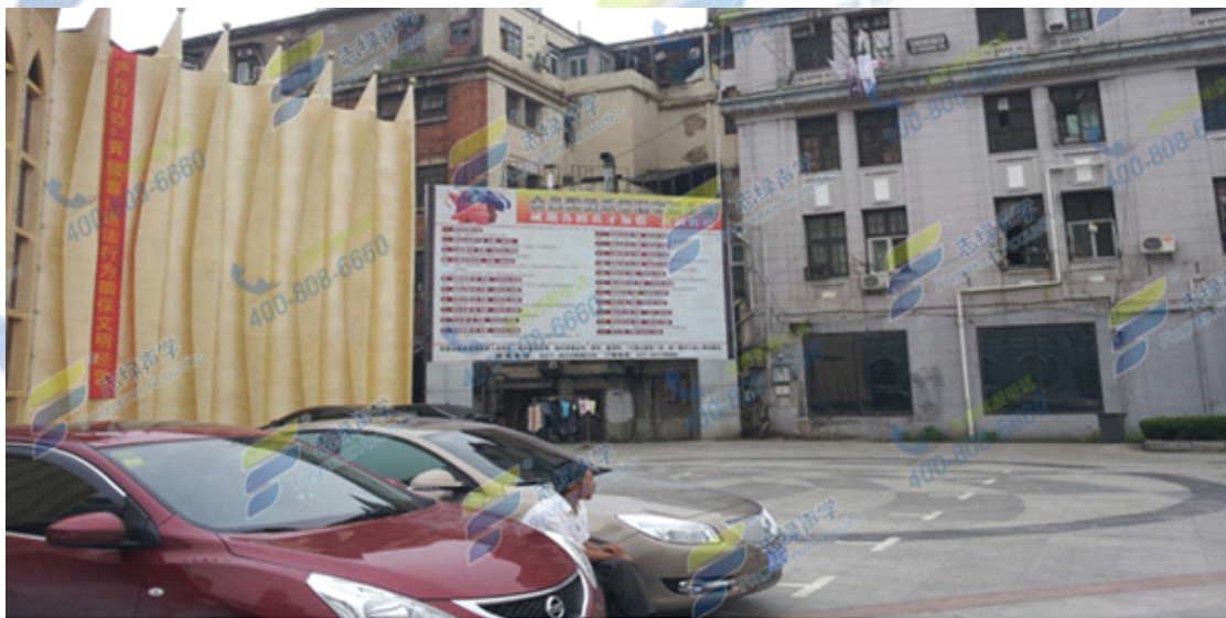
金皇冠周边居民楼

KTV 业主只能停业整顿，找了几家声学公司进行了方案对比，最终选择志绿声学为其解决隔音问题。志绿声学获知本项目的急迫性后立即派员实地考察，现场提出解决方案：首先断开 KTV 建筑与居民楼的直接连接，然后 KTV 内部采用志绿隔音板和减振垫做减振隔音房中房结构。为了使业主减小经济损失，尽早开业，志绿声学加班加点提早完工。项目完工后顺利通过环保局验收通过。业主对志绿声学认真负责的态度，达到的效果都非常满意。