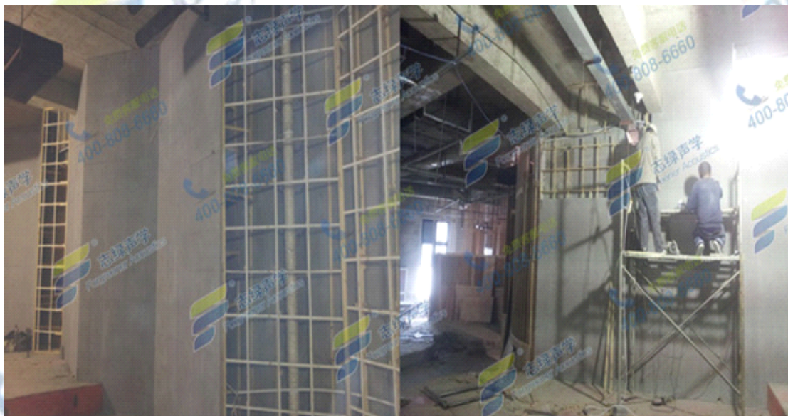
搭建木龙骨安装隔音板