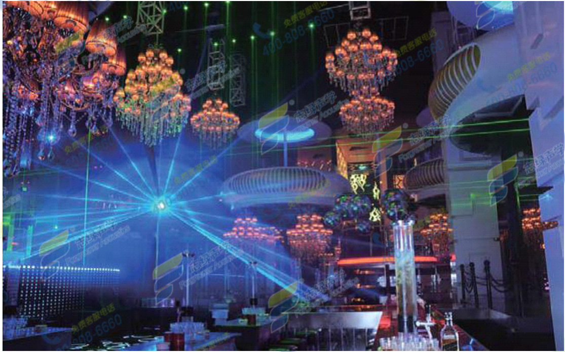
酒吧内装设计效果图