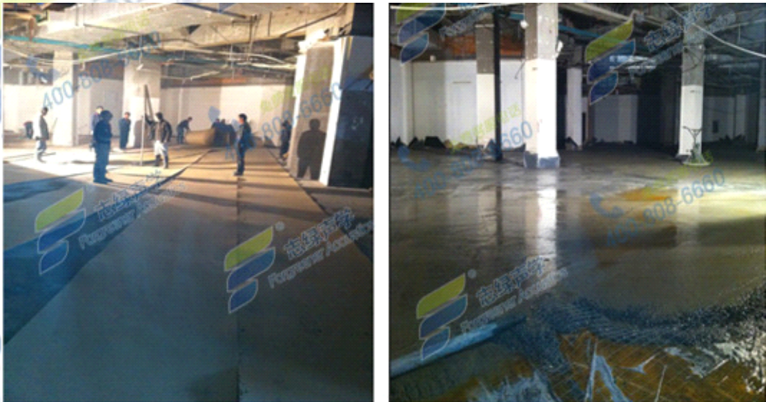
酒吧地面减振施工图

在工程前期业主询问过多家声学设计公司，做了样板间测试，均未达到预期效果。最后志绿声学提供的样板间测试结果让业主出乎意料，完全高出预期。志绿超微晶阻尼防火隔音板组成的隔音隔墙系统效果最好、墙体最薄、施工最简单、工期最短。项目完成后，居民不再投诉。