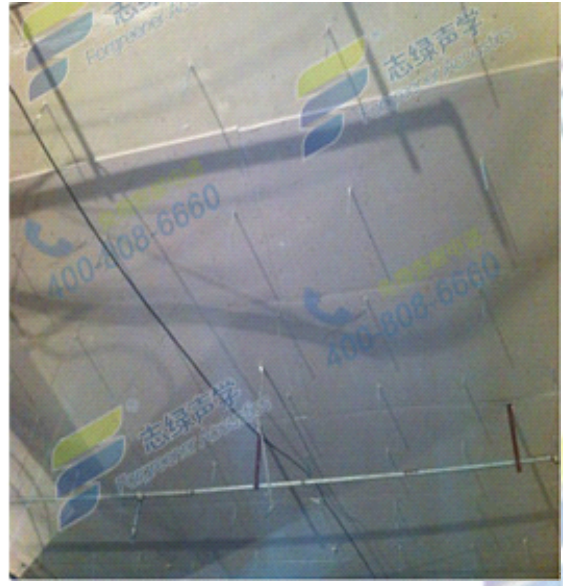
酒吧顶部的隔声处理