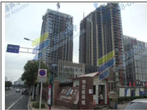
图一：慈溪环球中心整体图

经与业主方工程部详细沟通，根据现场情况，项目正式签订供货及技术顾问合同。经过志绿声学技术人员的努力及施工工人的积极配合，项目于 2012 年 6 月中旬完成样板间，经过专业噪音检测仪测试，南京志绿隔声板做的隔墙隔声值在 59dB。业主对于测试的结果相当满意，并当场就决定所有墙体采用南京志绿隔声板。志绿隔声板能够在增加极小的厚度达到理想的隔声效果，远远超过酒店业主的预期。