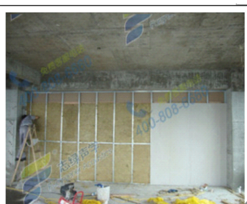
图四：填充岩棉后安装隔声板。