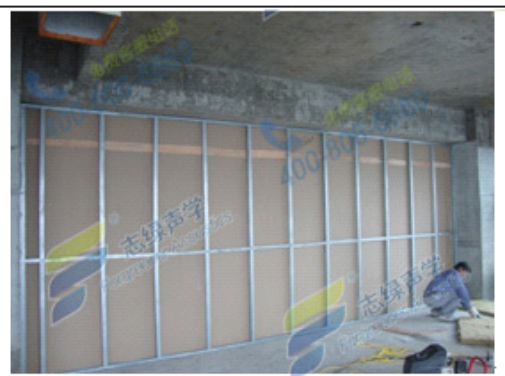
图二：搭建好后的单龙骨墙