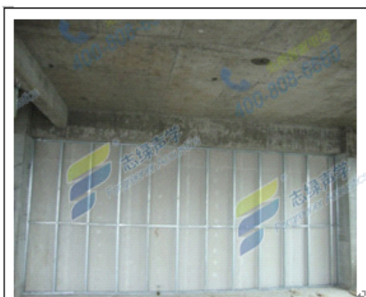
图三：搭建好后的双龙骨墙。